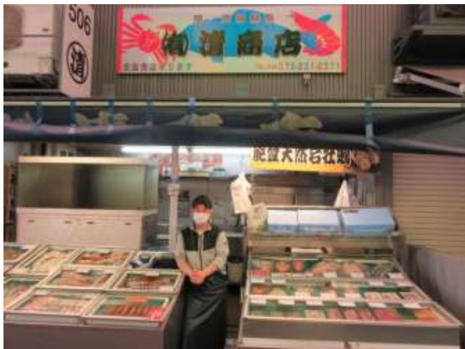
高級魚「のどぐろ(赤ムツ)」