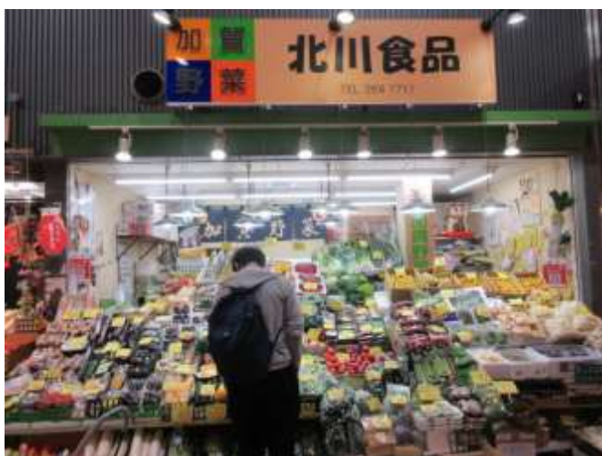
頭の高さまで積む、ヨーロッパの市場のような陳列 これが狭い間口での商売の仕方