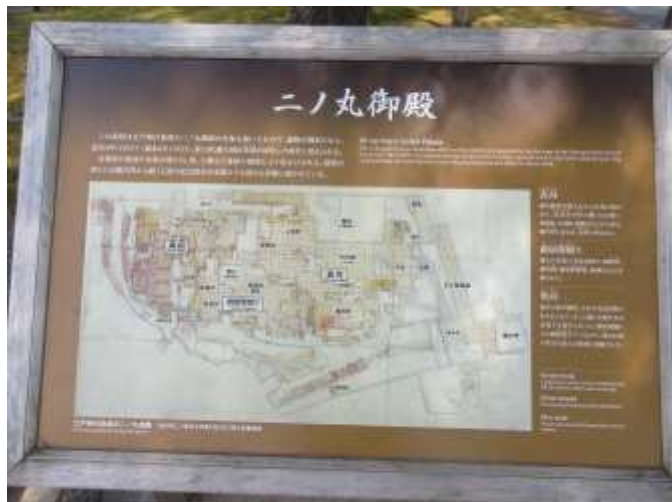
東側(福井側)に玉泉院丸庭園 平和的だ