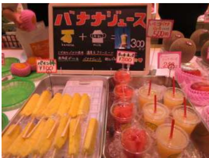
パインカットとスイカカット