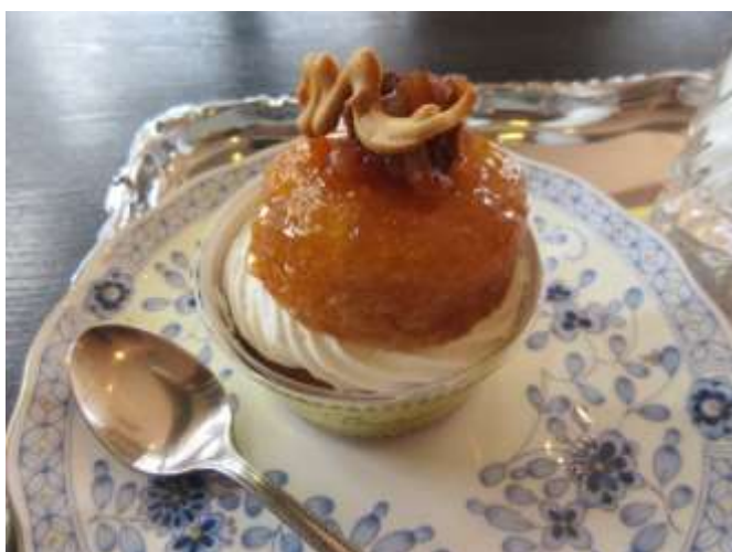
ラム酒の味も昔のまま イタリアのドルチェ「ババ」を参考につくられたのが「サバラン」