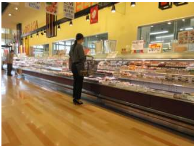
揚げ物、弁当売場 夕方であるため在庫は少ない