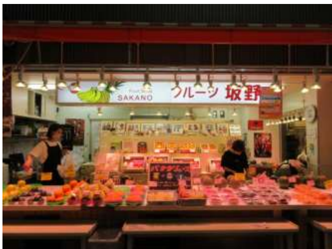
パイン棒 100 円 バナナジュース 300 円