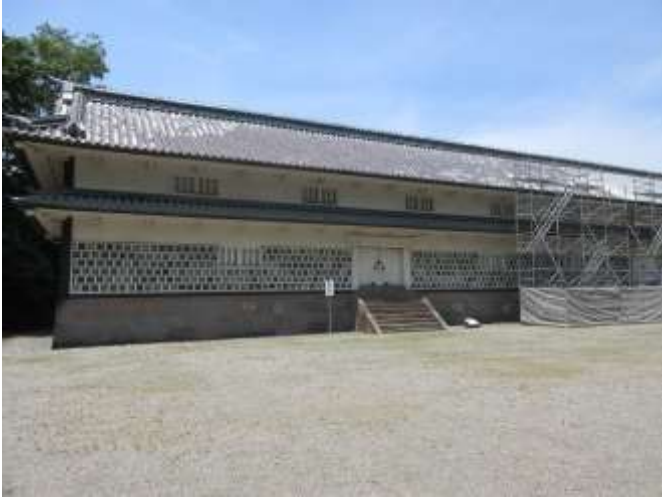
これも西の防衛設備だと思う