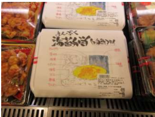
白身フライのグレードが高くておいしい